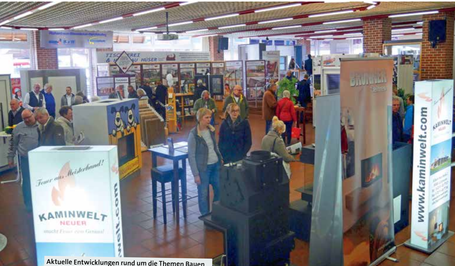
Aktuelle Entwicklungen rund um die Themen Bauen und Renovieren werden auf der Messe präsentiert.