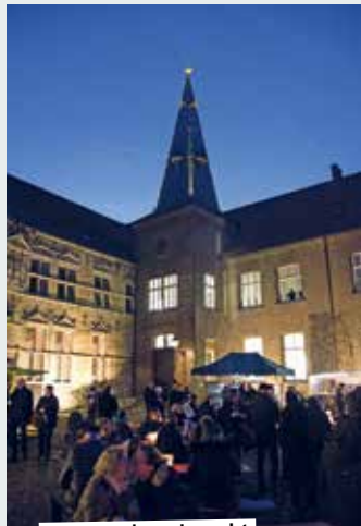
20.12. Abendmarkt Weihnachten Spezial