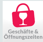
Geschäfte &amp; Öffnungszeiten

Im „Stadtleben-Kalender“ finden Sie die Termine aus der Stadt: Ob Märkte, Kabarett, Konzerte oder Badminton-Bundesliga .