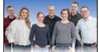
IHR RADIO KIEPENKERL-TEAM

NACHRICHTEN FÜR DEN KREIS COESFELD UND DAS MÜNSTERLAND (6.30 - 19.30 Uhr)