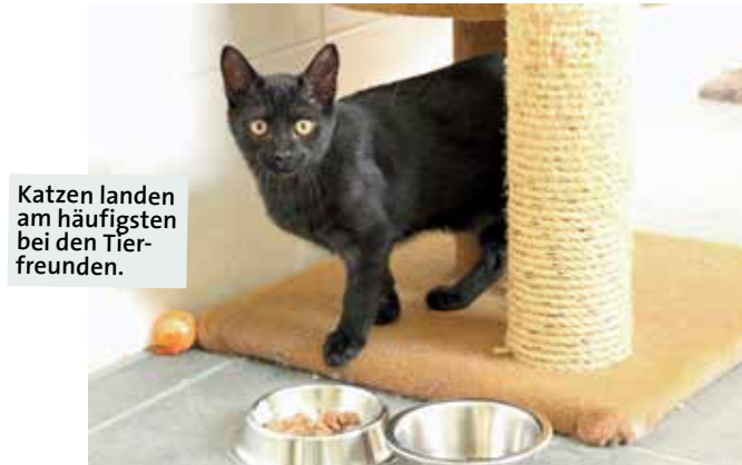
Katzen landen am häufigsten bei den Tierfreunden.

Welche Tiere nehmen Sie auf? Wenn ein Hundebesitzer so krank geworden ist, dass er seinen Hund nicht mehr versorgen kann, dann kann das Tier zu uns kommen. Manchmal sind es veränderte