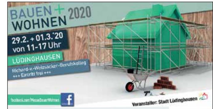
Die Messe findet bereits zum 22. mal statt.