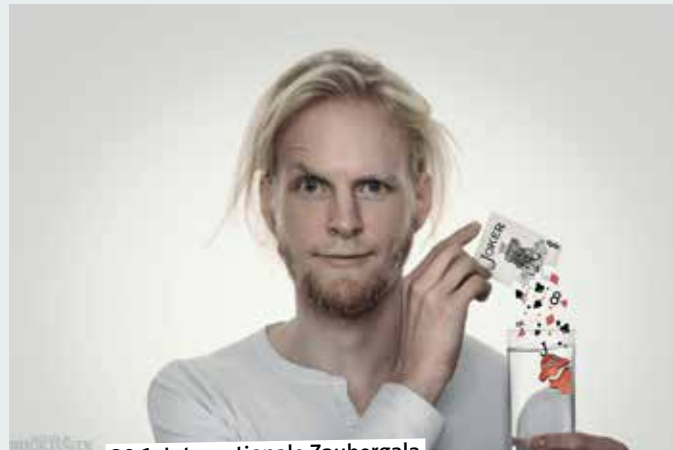
20.1. Internationale Zaubergala

19.30 – Plattdeutsches Theater. „Ne Macke hett doch jeder!“ von Beate Irmisch. Aula der Realschule (Sekundarschule), www.plv.de