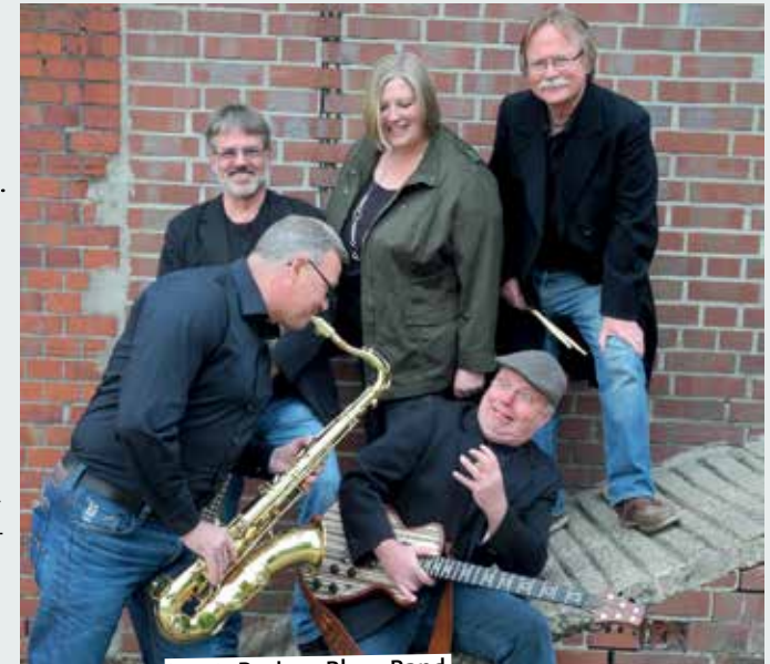
27.12. Beckers Blues Band

19.00 – Silvestergala . Mit Tanz, Galabuffet, einem Glas Secco zum Jahreswechsel und einer Überraschung kurz nach Mitternacht! Lassen Sie mit uns das Jahr zu Ende gehen und feiern in das Kommende hinein. Es erwartet Sie Musik von einem professionellen DJ von SAL-Showtechnik, ein leckeres Galabuffet, ein Glas Secco zum Jahreswechsel und viel Spaß und gute Laune. Ort: Steverbett Hotel, Tickets zu € 99,00 pro Person im Steverbett Hotel. www.steverbett.de