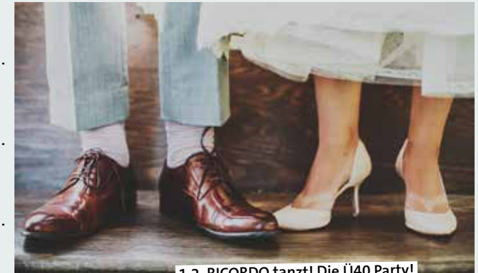
1.2. RICORDO tanzt! Die Ü40 Party!