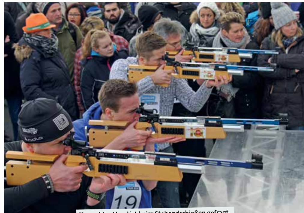
Eine ruhige Hand ist beim Stehendschießen gefragt.

Tagessieger wird der Schnellste der fehlerlos schießenden Wettkämpfer. Den Etappensieger erwartet ein einzigartiger Preis. Sie oder er darf sich auf ein Biathlon-Erlebniswochenende im bayerischen Ruhpolding freuen und