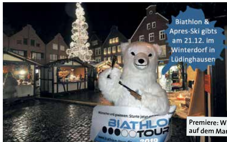
Premiere: Winterdorf auf dem Marktplatz.