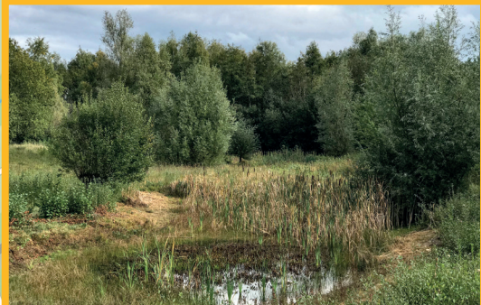
Das Lippsche Holt