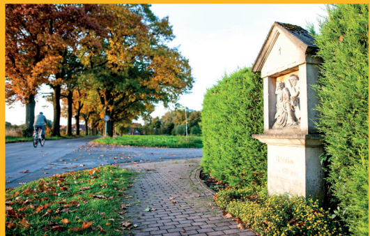
Kreuzweg an der Wanderroute