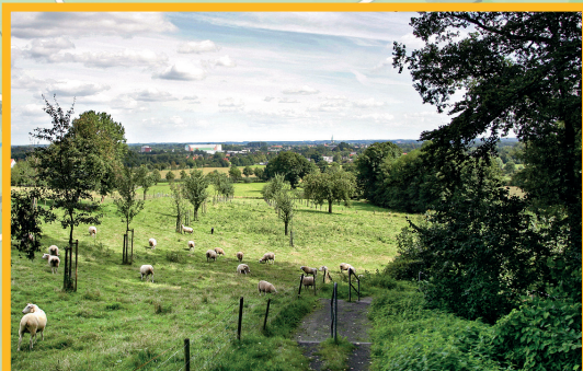
Aussicht vom Rosengarten auf Lüdinghausen