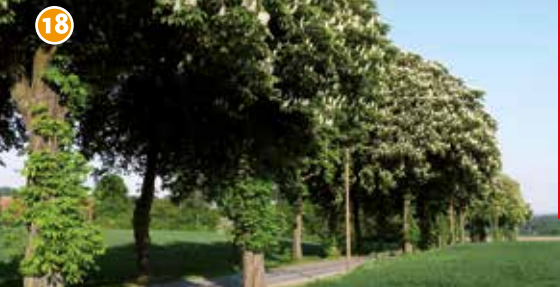
18 Kastanienallee in der Seppenrader Schweiz Die weithin sichtbare Allee verbindet die Bundesstraßen 235 und 474 und ist ein wichtiges Element für den Biotopverbund.