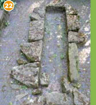
22 Kopfnischengrab - rund 1.000 Jahre altes, besonders gestaltetes Grab.