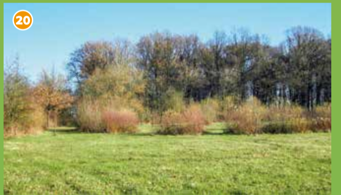
20 Naturschutzgebiet Lippsches Holt - Schutzwürdiger Waldbestand mit einer der wertvollsten Feuchtwiesen im Kreis Coesfeld, hier gibt es über 70 Blütenpflanzenarten.