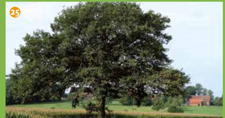
25 Solitäre Eiche - Der markante Baum steht unterhalb der Seppenrader Höhe, er prägt weithin sichtbar das Landschaftsbild und ist ein wichtiges Refugium für Brutvögel und Insekten.