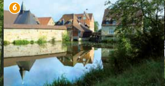
6 Burg Kakesbeck - Eine bereits im Mittelalter erwähnte, vielfach umgestaltete Wasserburganlage (in Privatbesitz – Besichtigung nur nach Anmeldung).