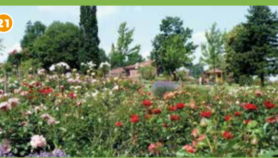
21 Seppenrader Rosengarten - Vor fast 50 Jahren von engagierten Bürgern auf einer ehemaligen Mülldeponie angelegt, wird der Garten bis heute ehrenamtlich gepflegt – über 700 verschiedene Rosensorten sind ein Besuchermagnet.