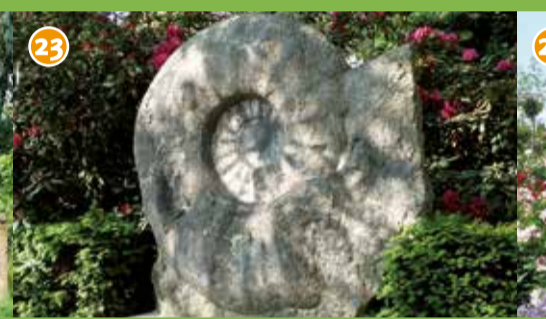
23 Seppenrader Ammonit - Der weltgrößte (!) Ammonit wurde 1895 in der Bauerschaft Leversum gefunden. Eine Nachbildung steht im Dorf, das Original im Naturkundemuseum in Münster.