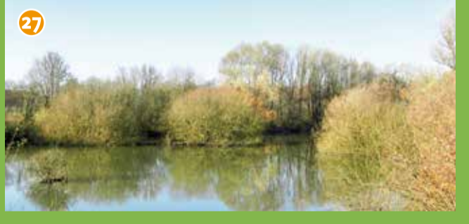
27 Naturschutzgebiet Plümer Feld - Verwunschene, reich strukturierte ehemalige Tongrube. Laubfrosch-Vorkommen und sieben weitere Amphibienarten. Das Naturschutzgebiet wird ehrenamtlich betreut.