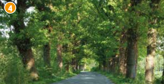
4 Alte Eichenallee im Berenbrock. Sie verbindet die Burg Vischering mit dem Klutensee. Sie ist wegen ihrer Bedeutung für den Biotop- und Artenschutz über das Landesnaturschutzgesetz geschützt.