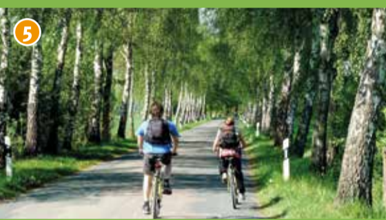
5 Birkenallee in der Bauerschaft Elvert. Die bei jedem Licht besonders und malerisch wirkende Allee ist zu jeder Jahreszeit sehenswert. Wie alle anderen Alleen in NRW ist sie auch über das Landesnaturschutzgesetz geschützt.