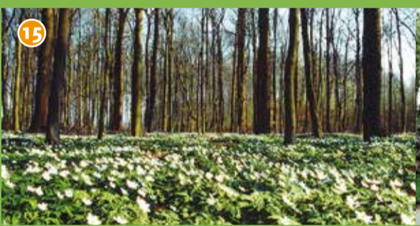
15 Kranichholz - Ein typischer Münsterländer Eichen- Hainbuchenwald mit wunderschönem Blütenteppich des Buschwindröschens im Frühjahr.