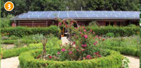
3 Biologisches Zentrum - Umweltpädagogische Einrichtung für den Kreis Coesfeld, mit westfälischem Bauerngarten, alten Obstbäumen und naturnah gestalteten Bereichen.

Ansprechpartner zu inhaltlichen Fragen: Biologisches Zentrum zu touristischen Fragen: Lüdinghausen Marketing