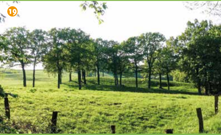
19 Naturschutzgebiet Seppenrader Schweiz - Eine für das Münsterland überraschende Landschaft mit steil abfallenden Hügeln, tief eingeschnittenen Kerbtälern und weiten Münsterlandblicken.