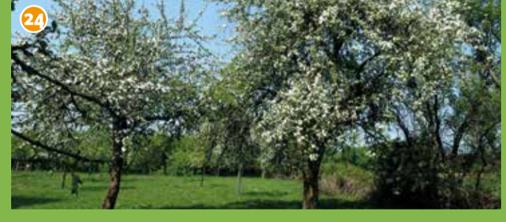
24 Obstwiesen um Seppenrade – Sie gehören zu den charakteristischen und schönsten Lebensräumen des Ortes. Obstwiesen sind bedeutende Lebensräume für viele Tier- und Pflanzenarten, z.B. ein Garant für den Erhalt der Steinkäuze in der Region.