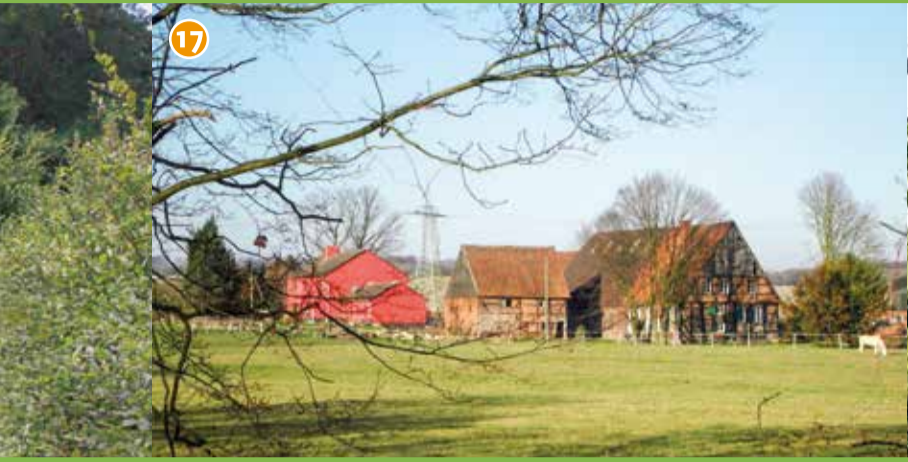
17 Hof Grube - Ältestes Fachwerkbauernhaus Norddeutschlands, dessen Wurzeln vermutlich 1000 Jahre zurück liegen. Die ältesten erhaltenen Bauteile stammen aus dem frühen 16. Jh., die Gebäude befinden sich in privater Hand und werden aktuell umfangreich renoviert.