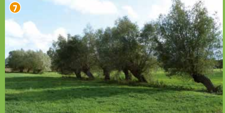
7 Alte Kopfweiden nahe Burg Kakesbeck - Kopfweiden sind, ebenso wie die Obstwiesen, ein typischer Bestandteil der historischen Parklandschaft des Münsterlandes und wichtig für den Naturschutz. Der regelmäßige Rückschnitt der Triebe ist nötig für ihren Erhalt.