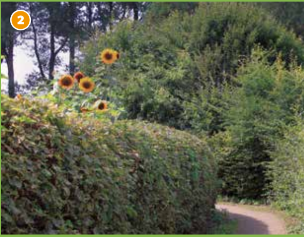
2 Wallgärten um Burg Lüdinghausen - Gärten einer alten Ackerbürgerstadt, durch hohe Hainbuchenhecken gegliedert. Sie bilden den äußeren Ring der historischen Wasserburgenlandschaft und gehören zu den stadtnahen, arterhaltenden Lebensräumen.