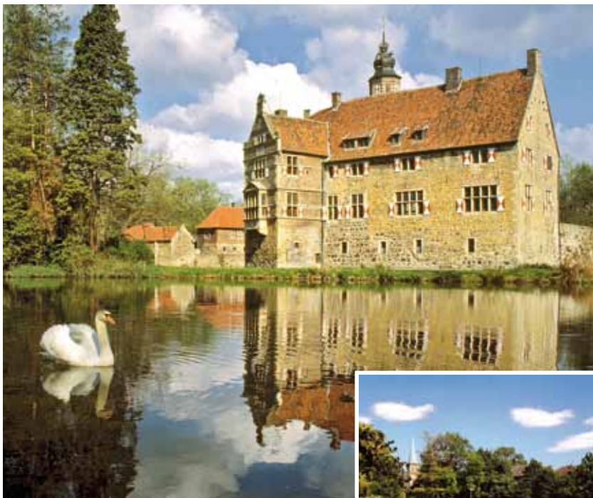
→ Wasserburgen, viel Grün in der Stadt und verschlungene Wege an drei Steverarmen: Lüdinghausen.