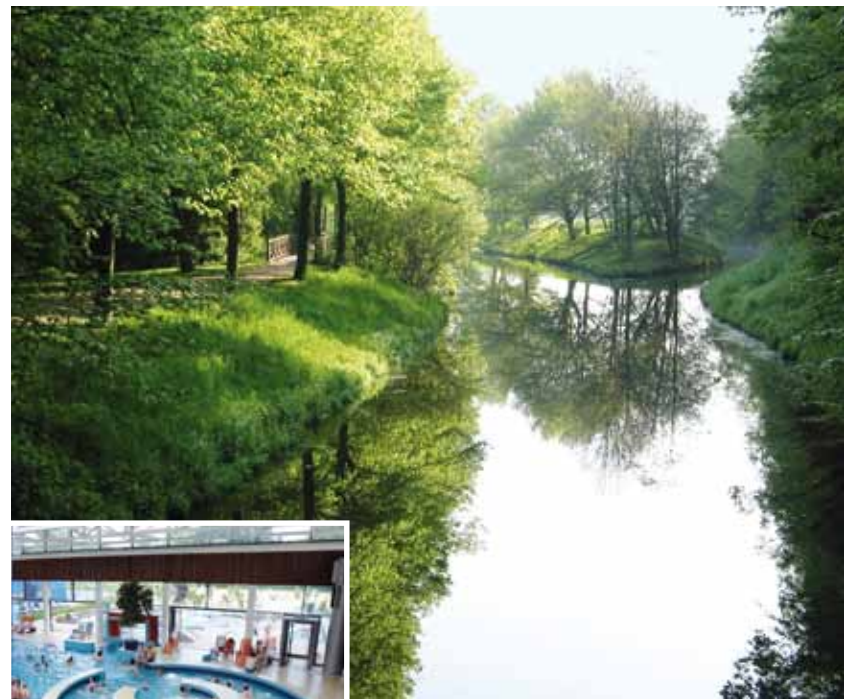
→ Die Stevergemeinde Senden wartet mit einem Naturlehrpfad und dem Cabrio-Bad auf und hat ein herrliches Umfeld zum Wandern und Radfahren.

Infos finden Sie unter: www.luedinghausen.de